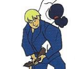
Waki-gatame Oksel/flank controle