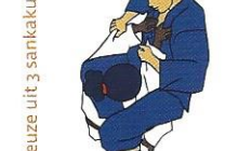
Gyaku-juji-jime Omgekeerde gekruiste verwurging