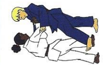
De-ashi-barai Voorste beenveeg