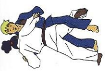
O-uchi-gari Groter binnenwaartse maai