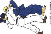
Koshi-guruma Heup wiel