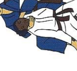
Tori-rug Uke tussen benen