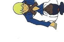
Nami-juji-jime Gewone gekruiste verwurging