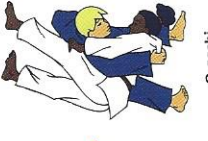
O-goshi Groter heup