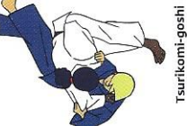
Turikomi-goshi Tillende heup