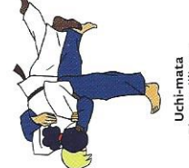
Uchi-mata Binnen dijbeen