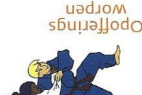
Tai-otoshi Lichaam neervallen