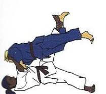
O-uchi-barai Groter binnenwaartse veeg