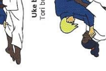
Yoko-sankaku-jime Zijwaartse driehoeksverwuring