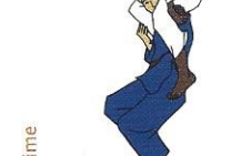
Sankaku-jime Onderliggende driehoeksverwuring