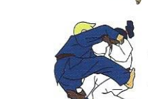
Sumi-gaeshi Gehoekte tegenworp