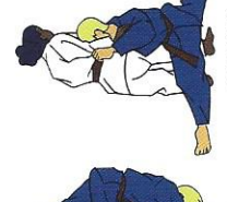
Yoko-tomo-nage Zijwaartse boogworp