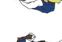
Okuri-eri-jime Beide reviers verwurging