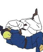
Morote-jime Tweezijdige verwurging