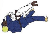
Okuri-ashi-barai Beide beenveeg