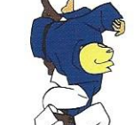
Uke-rug Tori tussen benen