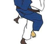
Hadaka-jime Naakte verwurging