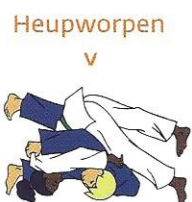
O-goshi Grote heup