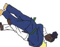
Hiza-guruma Knie wiel