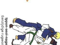
Ippon-seoi-nage Eenzijdige rugworp