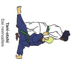
Tami-otoshi Dai neervallen