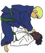
Morote-jime Tweezijdige verwurging