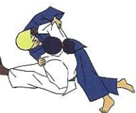
Tsurikomi-goshi Tillende heup

1 variatie en 1 bevrjding van elke houdgreep