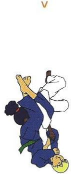
Juji-gatame Gekrúste controle