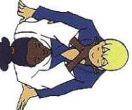
Gyaku-fuji-jime Omgekerde gekrúste verwurging