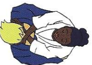
Nami-fuji-jime Gewone gekrúste verwurging