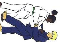
De-ashi-barai Voorste beenveeg