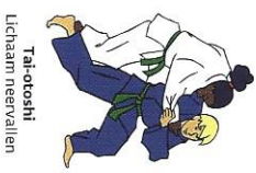
Tai-otoshi Lichaam neervallen