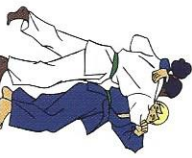
Koshi-guruma Heup wiel