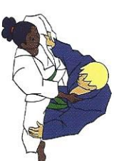
Uke rug Tori tussen benen