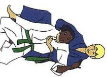
Okuri-eri-jime Beider revers verwurging