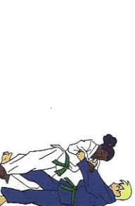
Ko-uchi-gari Kleine binnenwaartse maai