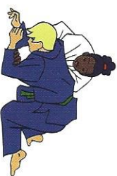
Uke bok Ellebogen/Knieën